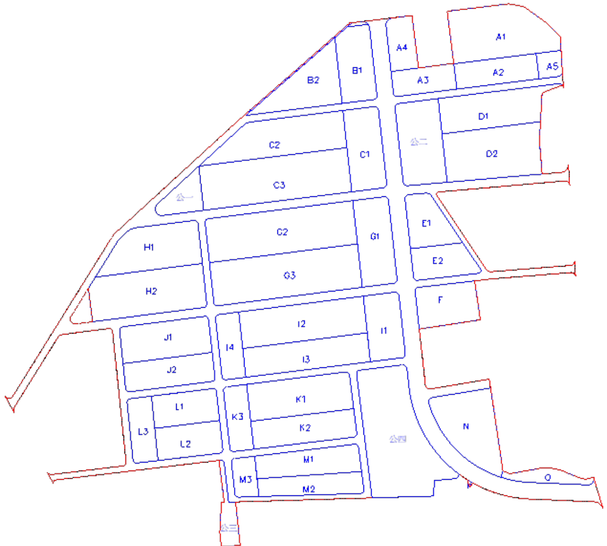
小東市地重劃區街廓分配示意圖

註：若有意進駐本工業區，可於投資意願調查表〔3.〕欄位中填寫需求街廓編號，供本府未來規劃參考。